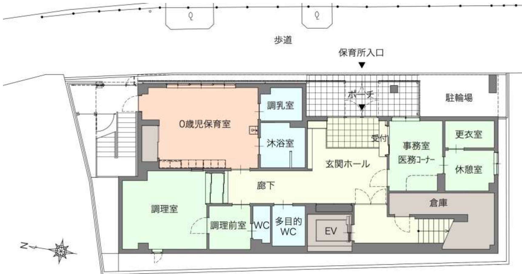
0 1 3 5 10 1階 平面図