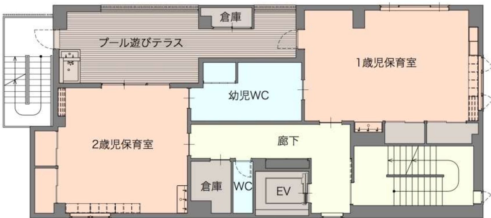
0 1 3 5 10 2階 平面図