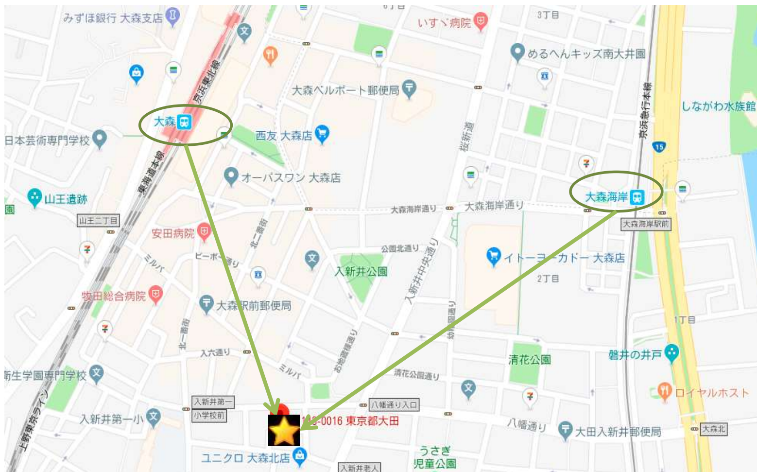
このえ大森北保育園